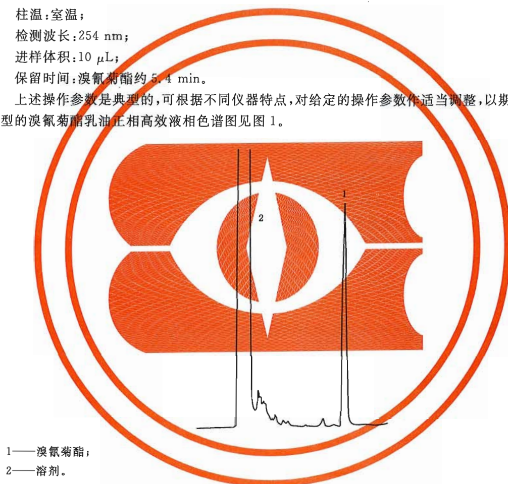
图 1 溴氰菊酯乳油的正相高效液相色谱图

上述操作参数是典型的,可根据不同仪器特点,对给定的操作参数作适当调整,以期获得最佳效果。 典型的溴氰菊酯乳油正相高效液相色谱图见图 1。